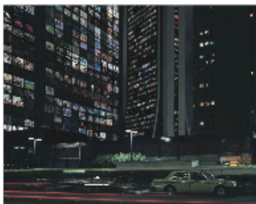
«B 14 », 2004 de la série TV .