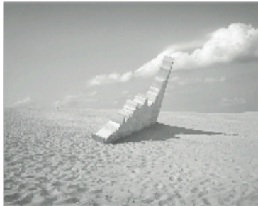
«Crude Oil Prices 2003-2008», 2008 de la série Monuments .