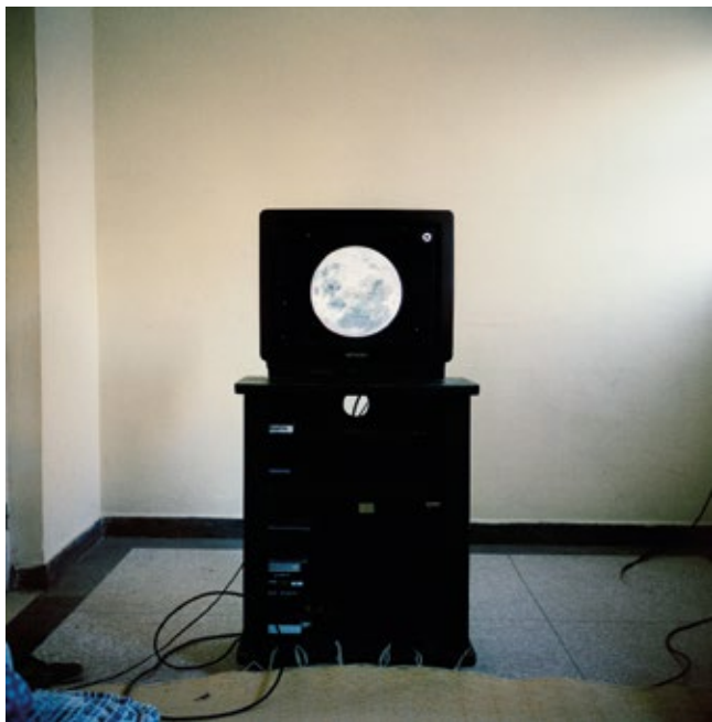
«Watching TV», 2003-2007