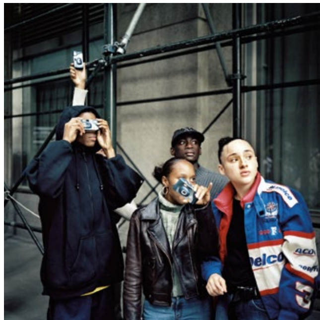
«Autour», New York, 2001-2002