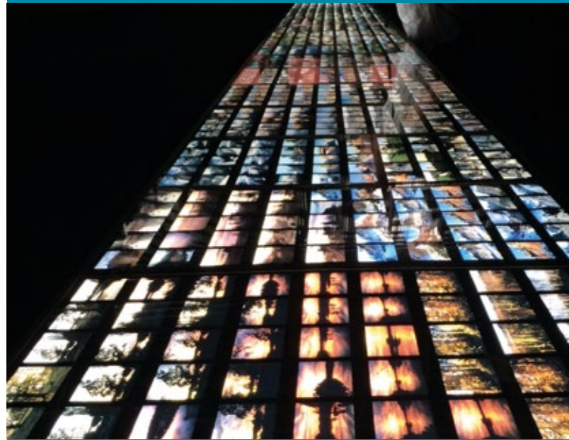
© photo AL : Peter Fischli et David Weiss, Visible World, Arles, 2017

Comme lors des précédentes rentrées, il a donné lieu à la présentation des nombreuses activités prévues pour fin 2017 et 2018.