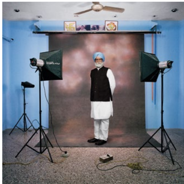
«The Others», 2009-2014