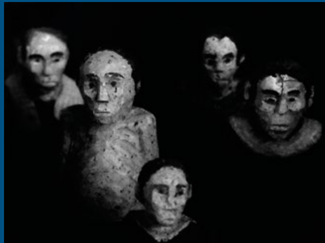
© Laurence Leblanc, « D'argile », Cambodge, 2013