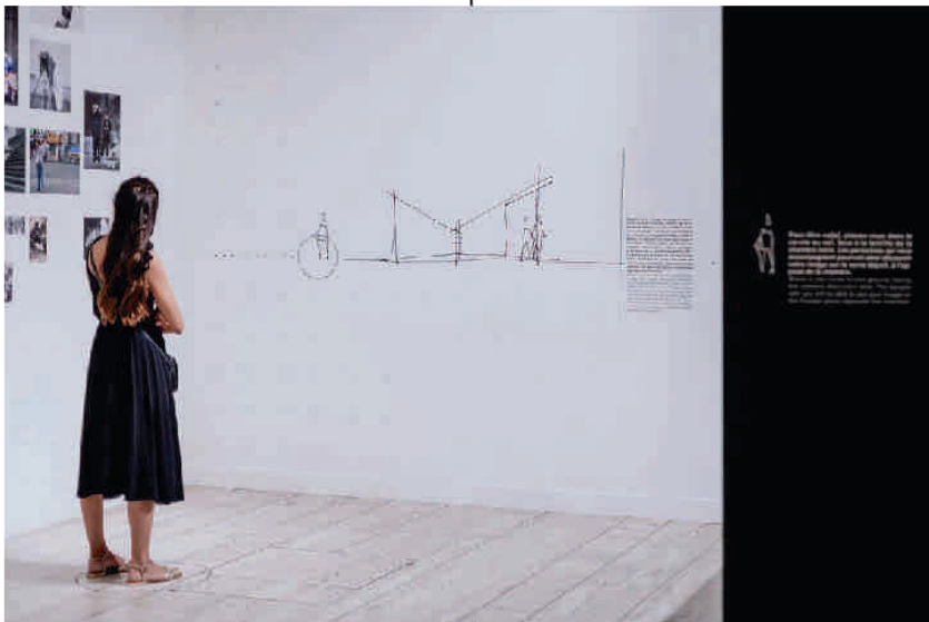
Vue d'une salle d'exposition

Créé en 1972 à Chalon-sur-Saône, ville de naissance de l'inventeur de la photographie, le musée Nicéphore Niépce a constitué en un peu plus de quarante ans d'existence l'une des collections photographiques les plus originales en Europe. Des premières héliographies de Nicéphore Niépce aux technologies numériques, cette collection de plus de quatre millions d'images et d'objets raconte les multiples histoires de la photographie. Le musée se donne pour mission d'établir un rapport entre les inventeurs, les pionniers et les créateurs d'aujourd'hui et tourne sa réflexion vers l'analyse de l'image dans une acception plus globale : ses applications, ses effets, ses codes.